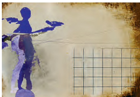
Seiten 6–7 Francine Mury, Walking around limited space , 2020. Ölfarbe auf Papier, numerische Collage. 30 x 42 cm. www.francinemury.ch