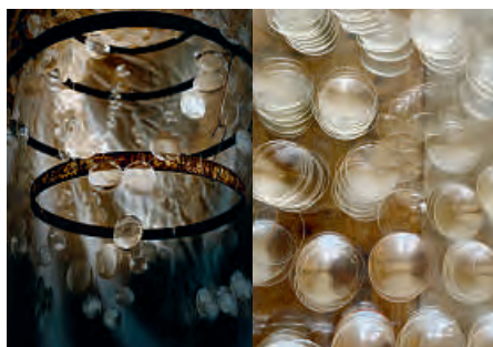
Seiten 54–55 Eva Ducret, Gekröntes Haupt im Licht , 2020. Fassreifen, Lupen gläser auf Nylonfaden (Girlanden), Verbindungsstreben aus Metall. Ca. 180 x 90 cm. www.evaducet.com